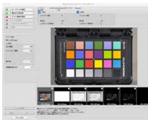
X-Rite社 Color Checker 対応