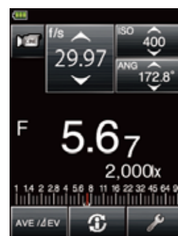
シネカメラモード画面

デジタルシネカメラ(映画撮影カメラ)に適したモードです。フレームレート 3 とシャッター開角度 4 を設定し、0.1 ステップ毎の露出コントロールが可能です。