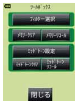
ツールボックス画面