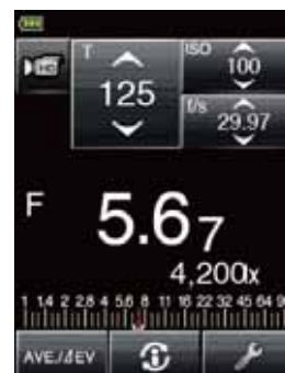
HDシネカメラモード画面

デジタルカメラのムービー機能やデジタルビデオカメラ等に適したモードです。シャッター速度とフレームレート 3 を設定し、0.1 ステップ毎の絞り値表示で露出測定ができます。